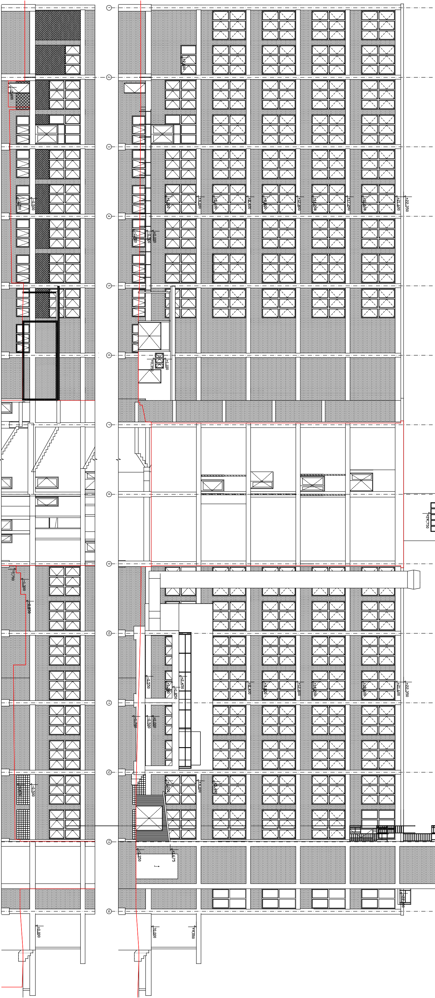
POHLED 5 – SEVERNÍ