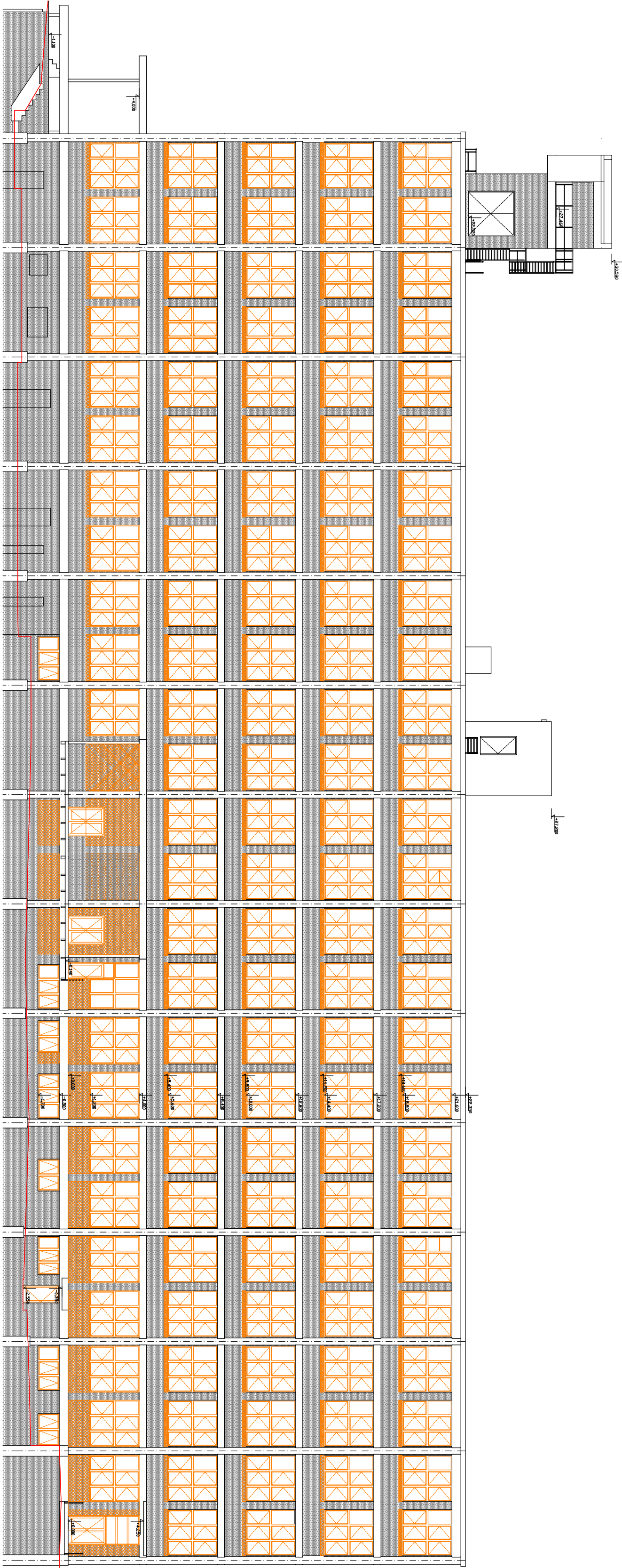
POHLED 1 – JIŽNÍ