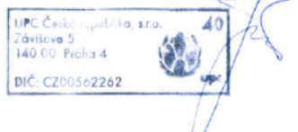
Jiří Juráš Oddělení dokumentace

Vyjádření vydala společnost UPC dne: 12.8.2016