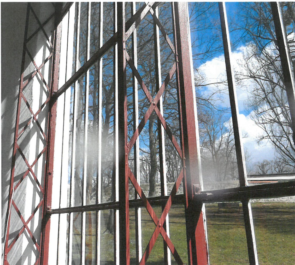
Obr.č. 4 Detailní pohled konstrukci příhradového nosníku.