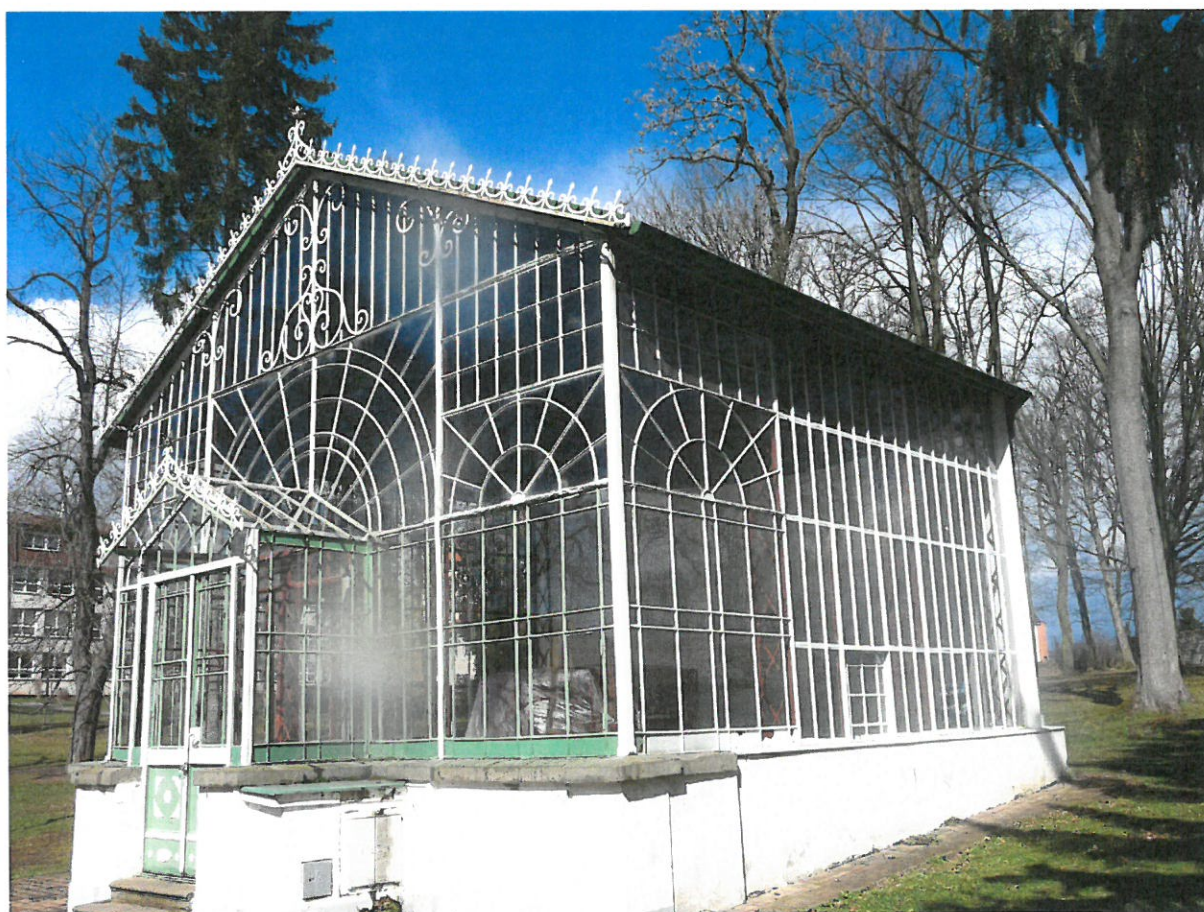
Obr. č.1 Celkový pohled na konstrukci altánu. Ze snímku je patrné členění konstrukce.