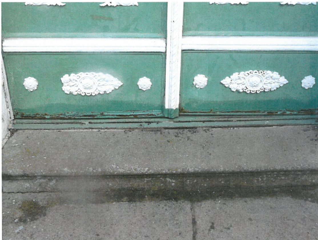
Obr.č. 8 Detailní pohled na spodní část dveří z venkovní strany. Ozdobné litinové prvky jsou mechanicky poškozeny.