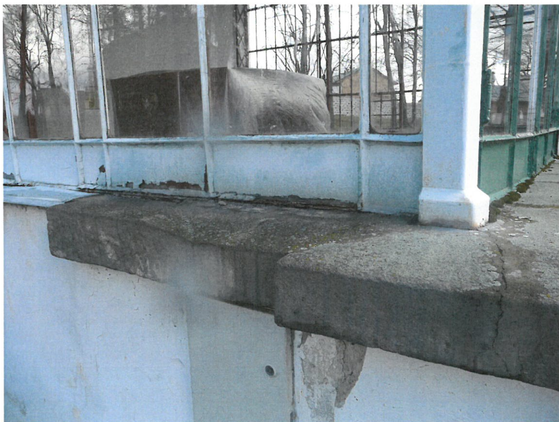
Obr.č. 5 a 6 Detailní pohled na část konstrukce z venkovní strany. Ze snímku je patrný rozsah poškození způsobené korozním procesem. Spodní pole konstrukce jsou opatřeny plechovou výplní.