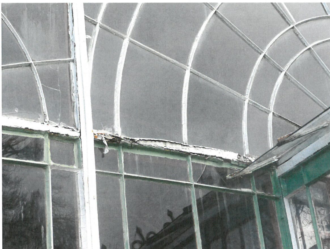
Obr.č. 7 Detailní pohled na stav konstrukce z venkovní strany. Nárůst korozních zplodin odtrhl jednotlivé příčky konstrukce od sebe.