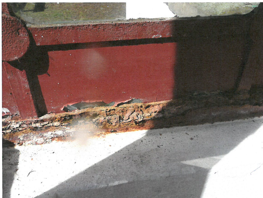
Obr.č. 2 a 3 Detailní pohled na spodní část konstrukce z vnitřní strany . Ze snímku je patrný rozsah poškození. Působením korozního procesu došlo k úbytku základního materiálu natolik , že je místy bez kovového jádra nebo zcela chybí. Nárůst korozních zplodin ve styčných plochách deformoval některé části konstrukce.