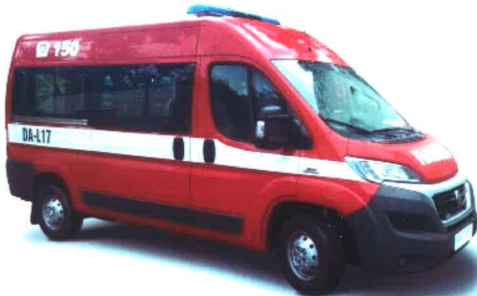
Obrázek 1 - Ilustrační foto