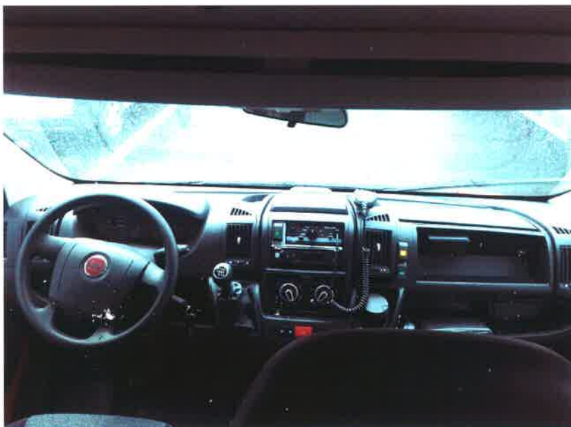
Obrázek 4 - Přístrojový panel DA Fiat Ducato

Ovládání výstražného světelného a zvukového zařízení vč. oranžových světel je v centrální části palubní desky DA.