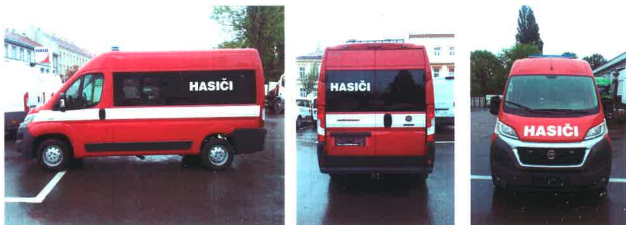
Obrázek 3 - Ilustrační foto DA Fiat Ducato