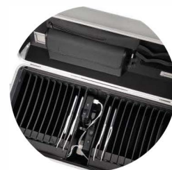
20x přihrádka pro iPady