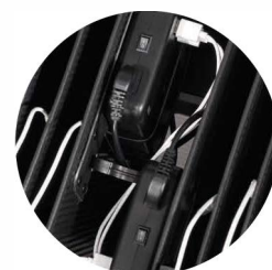
2x MC10 napájecí modul

rozměry jsou uváděny v milimetrech in mm